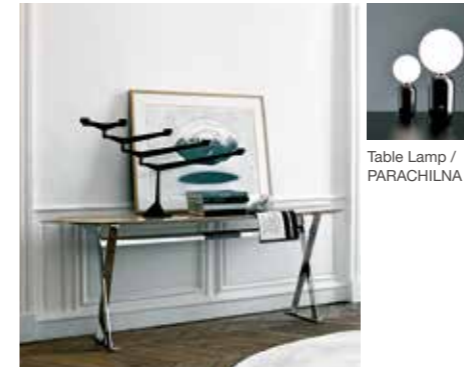
Entrance Console / Maxalto