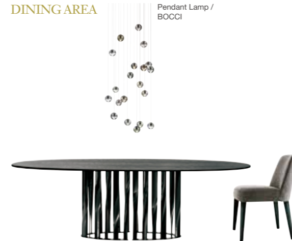
Dining Table / Cassina