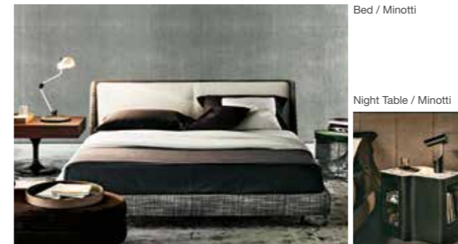
Bed / Minotti