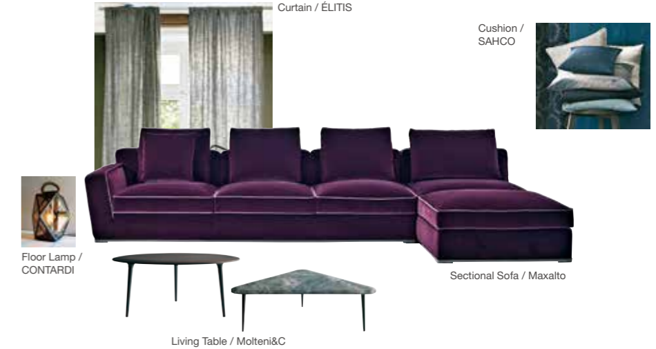
Floor Lamp / CONTARDI