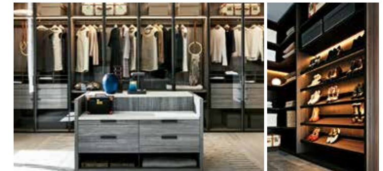
Walk-in-closet / Molteni&C