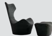
Outdoor Furniture / B&B Italia